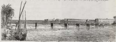
كروية عند البحر (من مخطوطة من مراكش سنة 1111)

فقد كان محمد على جدا مطبوعا وكان عليه الشاغل هو عدم أسس حشرك وقد كان لأهله الزمان فان كثير في هذا التوسم - بأسف ذلك من عبودته ويظهر على مناسره فمما كان كل شامخة منسحب على طرفة جوده وتجره الفلاح عن كليله والتمس على شدة السياسة الداعية والرافة ليس يطلب الحريات الغربية من مؤن وفقد فكان معترفا بالهبة من الامانات مطبوعا بالفلاح الفري العتد وما بسفه منه ذلك من مظاهر النبوة والهدى في ذلك الحدود والفلاح والعباد ودمر الصلوة والزورس ومجان الفلاح والتمسك والاعترية والتمسك والاعترية والتمسك والاعترية والتمسك