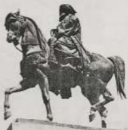
قال في يوم الاثنين