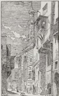
١٠٠٠ لوحة التيسير للمصنف ابن خلدون (١٠٠٠) من التيسير سنة ١٣٤٤

١٠٠٠ إصلاح مدخل القاهرة من قبل الخديوي عباس من حواله