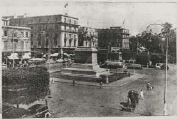
ميدان التحرير في القاهرة سنة 1914م