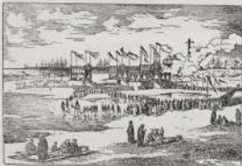
مطلة جامع القل