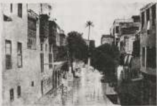
الشارع الجديد في القاهرة بمصر سنة ١٩٠٤

وقد أنشأ الخديوي إسماعيل في اتجاهه الشمالية قصر خاص به مائة إلى مائة عشرين برفدها من حديق واجهة - وكان يصل فيه صلاة الجمعة.