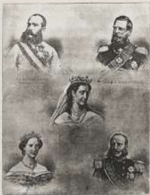
قوة وآراء الذين همروا بمخاض نهضة المصريين