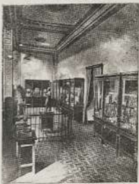
سفر لبار الأثار القديمة من حيا