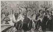
أندو العفات التي نادى بها المصريون أصواتهم باسمها الأبرار والسياسيين

وبلغ عددهم المليونين في مصر أساهلها سنية حربية وذلك برغم معارضة زكاً في زيادة القوة البحرية المصرية