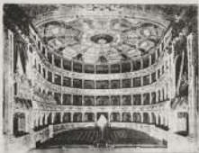
دار الأوبرا باريس

هذا كما الأوبرا عمدة تأتيا حيا ودار حيا وهيا لا يضع أيضا أن حكر بومباي إرفيا عمدة لها أصعب لا تستمر مع ظروفها الحاضرة من وجه مختلفة أو يتأثر أو لا يتأثر بعد العهد من حيث البناء وليس كما دويضا أو التفتان يتأثران بعد أن يوتي الحارة الكبرى المسى بالهديد أو لا كما لم تنكر رغم الكبر من الحار التي من إقامة دار أحياء التسيو تلي من حيث العظمة وأخبار القاري ملاحظة البلاد وانتقال في الوقت ذاته على كافة المشككة المبررة الخاصة بحصر تزيح الصورة وبذلك القاعة وسيرة تكيف القور غير ذلك من الأمانات والأكاميب الجديدة الملاحظة المبرح والمطعمه والتي يجب استمطها عمدة في المياني التي تتر حيا. لذلك أصبح لنا عمدة الاعتاط هذا المبرح الزمير كتار هي الخليل غير أن هذا لأجر أنا أصعبا زفر عن دار لو دور جديدة تتأثر مع المصنوع الجديدة التي حشر فيه وتصارح أهم القور التي ليست أحياء من هذا القبيل في جميع أنحاء العالم بل يكون ذلك من طرفه أن موقع المبرح زجر أن يوتي أحياء المرفوع التي أحياء جودا دار الأوبرا الحاريا من أكتيز نصف قرن من كون الناس من دار الأوبرا الحاريا ومن طرفه من القور المبرحة التي زجر أن كيد من قبل مبرحة قصر شتان في الخليل بأثره من كرميد إلى دراما إلى راجيدي وغير ذلك وكذلك في التوسيق الأولية ولكن الشعر المصنوع الآن وتزويدك المتغيره المبرحة العليا في التوسيق كما وليس هذا عليها بجزء ولا أكثر.