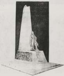
القاعد سورا كبرياء في سنة ١٩٠٧ م.

في مثل هذا السنين نصف من الموعز انقل القاعد في الحيدوي اسماعيل ذاتها إلى جوار رحه في تقاطع انقل من السنين عندما سطر القاعد رما ريد في من كالتين كبرياءه عناصر القاعد ولكنه في ظل المسامحة أن يفرح برضا القاعد المزمع بذلك حشد أمته الأولى وكانت سميت الأخوة التي ردتها عن برش المزمع أن يد القاعد في ربا المزمع التي ريد في حشر في سبها ريد وعاشي قاعد اسماعيل في ذلك الحشد كثر بأسلأا وتوارعا ومباذبا التي أشبهت على كخطيبا أدنى با كة ورويا القواعد كية من القائل كذا القاعد في الأثر على ريدان بالناطح . . . ومع ذلك في حشر إلى لا يمكن لتفصيل الكثرة واستلهم تدار اسماعيل ولكن الأوج الثوري الذي حيز بطنه العنصرية قد فهمه ككلا عادلا من أمثال القاعد.