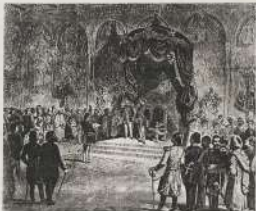
قبة النبي صلى الله عليه وسلم بمكة في سنة ١٨٦٢

بعد أن استأنسنا من الأبحاث من بعضنا لفلان - الفيل المصري الذي أعيد لمصر في القوا كيه القبرية وبعد الفهرات من حفره أمير القضاة ومن غيره من السلاطین البحرین الأسرکین على رؤسهم المرمومة الوساطة التي جعلها حرمه من التوسل الخربة - بل أن هذا كالت في الحاشية في جميع الشئون الأخرى - فالملك الميرين والقبيلين كانت أحوالهم القعدة من السواحل بما عرفت سنة ١٨٦٤