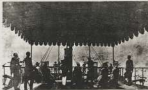
الجمام في سفينة التوربي من الأسماء المشهورة في العالم

مظاهر الحضارة الأخرى. وأتينا لنتحدث القصرى جالسة على الأتار المصرية من البرقة وكندا، دار الأتار القرية كما أنها دار القصد بالمراسية وبعد بادرتها إلى استجليل بناها المذكي العالم القصرى المشهور وأتينا أيضا مصالحة الشاسا.