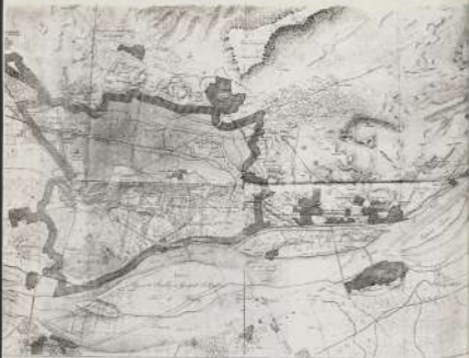
خريطة القاهرة القديمة التي بدأ عليها التخطيط التي تم تنفيذها