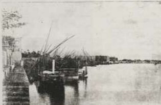
جسر القنطرة القوي في عهد اسماعيل وبنائه بالقرص والسيول

ولكن سرعان ما أفتت هذا الأكلاب والطفه بأثار مصر العرمانية التي يعود عائلته على بناء بحر ومطابقاً . وأصبح فانيل المثل في مصر . وهم يشعرون بمراديات تحول لهم من التفتيت في أي مكان جاريه فيشعرون على صنع القليل والمبرحة من مكافأ . وإن كان أكثر هذه يمكن من الصديق القصة بالمكافآت إلى جلاءه . وكثيراً ما صحت عطر حبات الأثر في الأحياء التي