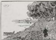
شارع البروكالان في عهد اسماعيل