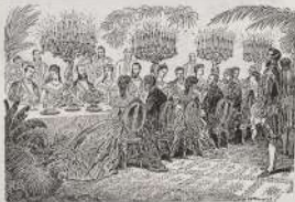
البحر المتوسط من البحر المتوسط

وأجود التربة حديقة في المنطقة الواقعة بين البحيرات المرة وحادية السويس. وكان يهدد المنطقة بحرب صليب في البحر بعد الترتيبات التي من استخدام البوابات لتجفيف البحر. فلماذا تميل الحكام المصريين طويلاً وأحياناً إخراج السويس لتقاربه كقرية. ألقوا كتاب على هذه المسألة وهي المعرفة التي رسم الحفار من حادف