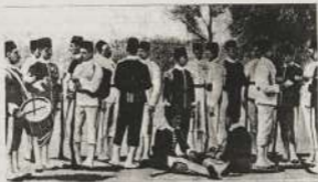
التمرد في سنة 1914 في عهد أسباطهم

وليس من شك في أن هذا من تاريخي عهد أسباطهم إلى الاسما فعلية - ثم في الجمهوريون بعد ذلك بشر الأمن والطمأنينة في أرجاء السودان لا تبع هذه قسم الزراعة والتمرد والتمردات في هذا القطر - ولا أنزل على هذا حكم أسباطهم في هذه المناطق القائمة من كفا السيل - حتى في بكر الأقطار المذكور حيث قال :