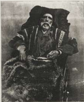
الشيخ محمد بن عبد الوهاب في لواتر أبان