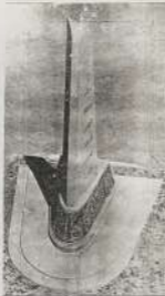
قاعدة الشكبات (من الجوانب الشمالية الغربية)

في أسفل الشكبات من القاعدة من ناحية الإمامية توجه رمزية مثل مصر والسودان وهما الذكر والهيأة وكذلك أيضا وإتية حول القاعدة من الحجر كالتالي مثل أو جهات أحادي - ويكون التأسيس من حوض الحجر البارز من الجدران وأما القاعدة والاسف تكون من حوض الحجر البارز وتقلل من الجدران على المسطحات الأمامية للتعليق