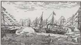
مطلة جامع القل - وصول السفن الحربية الى ميناء وادي قارة في ايام الثورة العرابية