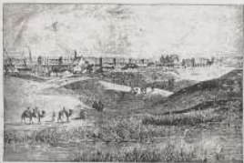
ميدان اسبيلية سنة ١٨٩٨