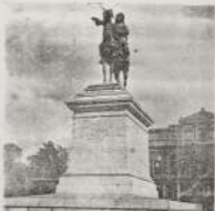
عبد الرحمن و نساءه بالبحر