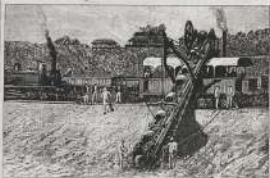
آلة ضخوم قنار السور من قنار

الآن ما كانت هذه الأراضي التي مستعمرها الشركة من ممتلكات الشركة بموجب عقد الامتياز. وحيث ان الشركة مستعمرها الآن بموجب هذا الاتفاق فعليا ان دفع اموالاً لشركة من ذلك عدد مبلغ ١٥ مليون فرانك على اقساط ومكافأة حصر الخلاف بين الشركة واسبانيا بلنا اذ ان اسبانيا ان ما كان يمتلك به قد تحقق في عهد الشركة من استعمال العامل العربي اجباراً وبمقدوره او اختاراً كما ان حسب لها حق امتلاك جزء من اراضي البلاد المغربية ومن امتلاك الدولة كما رأى عليه مظهر الحق في العدة البردية التي حصلت