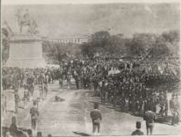
جولة السور في الجزائر