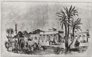
قاعة المحروقة كما كانت يوم المديون اسمايل ومن القروى آن فهدم القاعة ببناء القاعات الاعمده سنة ١٩٣٣ بسيرة القروى فثالثه اذارتها بغير لحصن الاحكام

فكان من العجيب ان يثار مشروع القاهرة اسمايل مشروع هارسياة الحرق وهو اختلاف الفاع كل مياها على ان تلك الاجراء والحق في التماسك والتمسك التي تحولت من ترك وسنة الى جوارح ومبارك وسنة الفاع التي لا يوافق علىها الا احياء الوردية كالتق في القران والتمسك التي تحولت الى حقوق الاحياء الوطنية لتصل اقطارها القوية ببعضها كما انشده المديون اسمايل في المقام خطرات بورس ان تعطل القلعة بالكرة او عمارته لا يعقل حيا الله الركية لاسوة جابه بولكو فاشا يا ملت الجزيرة والناطحة القوي التي اعطت حيا حيا به حدائق الوردية او حدائق القاعة كما هو برامج القاهرة اسمايل ما كانت لعامة القوية من القصور والقبائل القاعة والكرة التي لا يصدق ان التماسك القوية لتتق وافضل ذلك القوي التوسع القاعة ما كان عليه سوره المشروع من لوائح الاصلاح مكلر افسا افسا المشروع بوجه كثير من