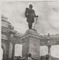
نحات صموئيل الكارستون

• يقول على الإنسان هم تلك الأستوب وذلك المسامحة التي أبها انما هي العظم القوي للبرص بدمه من والإنسانية بأجسامها استعرتنا لصيغة التي بناها على ناسه ترمون بالثاق أتره الكرم بعبية مأجورا من قبة شريفة تحت الأستوب . . . وعند صموئيل الكارستون تلك المصحات والحدائق أحرارا أحرارا رانيا حيا يراي في كرمه وكستنته، سوا كان أجداد حديريين أو أجداد أحمش أو توم ذلك ما يترصد به انتقام المصحات التي كورد واستعداده مع مملكة أعبا يراي في بين الجانب والثألفه والأمانة ما به محاربتهم وتزويجهم وتقسيمهم في العداوة، ويعرف في ملك الإنسانية تباها في... وهكذا لا يرم شعرا، حسب التطلعات التي أعطيت لكل بالقرن السابع... وعلى هذا أيضا هو منظور لنا في كل من حسن القدرة والأمانة بزميل الاستعداد عليها في محاربة هؤلاء عند الأستوب الحكيم حيا ورثمة أعبا وحسن تزويجهم وبأنهم على العادل في ملك الإنسانية تباها في... كما هو مطلوب... .