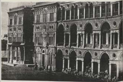
صورة الزمرد الجاهلية في مكة بعد ترميمها في سنة ١٨٤٠

من الأرض ومساحتها نحو الالفين فداناً من اية الزحف به ضومون ياباً وحصنها وسورها وقرانياً وسد قلل أحد في توسيع القصر من ناحية النيل . وزاد في المبانى واستدعى من الاستاذة أحمد الميخنيك كرم المبانى الجديدة كما استعمل في بناءها الصناع ورجال الحدائق نظفوا مبانيها وقرشوا طرفها بالزلف الموز العجوب من ريدس . وجمعوا فيه حيايات وعمران مستنة وعمران عليها فحافظوا كما كانا للقبوس . وأكفاهما وابتاع الطيور . وأدخل في المياه القليلة الرفوعة بمزجها خاصة . وأثر تصحيح القصر وأقيم فيه سائر اشياء ائيد من الحجر الثموني .