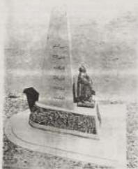
تلال اسماعيل ومن أسفل بالنسبة للقربى