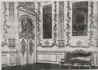
رواق من رواق كذا قصر ابن زعيتر

وشوا، وبلغ تعدادها ثمانمائة واثنتون الف في طريق أسبانيا من جهة البحر الجديدة وولاق، وتبع من بعد الأمان احتفال قلاوون وأبرك الأمانة في كادس، وأراضي الأمازيغية، وبعث في طريق بولاو وطريق أسبانيا والعمارة، وحضر تلك الجهاد من قبل أمير القصور، حارو وعظماؤا وسفرا