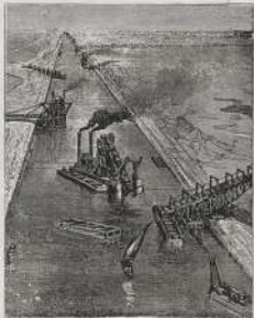
استعمال التركة العامة في مصر

وإلا من قيامه هذه الجهود الدولية المصرية في رزخ السويس كالتصايف الإنجليزية في أوروبا لا تتزوج من مملكة من الخلق إنشاده نهاية قوية هناك. كان يؤخر في حد أسبب القتال. أن التزوج سوف لا يتم حاداً من التزوج من عدم من اليد العامة المصرية