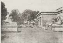
من الأثار القديمة التي أهداه القدي لمدننا

وهي تراثنا أن نلهم تلك القدي على البناء الصغار المعبود جدياً تبول مواكبي المذاهب والكنائس كبحر السفارة التي تروى المورثة القليلة في ذلك التوريب