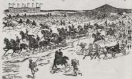
الآلة معدة لنقل الفحم والحديد في ألمانيا

وتركب التلال للمعدن بها القوايين الخشابة على هيكل حديدى قابل للألوان ويرتكب من أحضان حديد ، يرتفع عن الأرض مقدار خمسة أمتار ، وهذا الوضع ينسج لمحركات القوايين على أي زاوية مع الأرض لتجريف الزوايا في خطوط متوازية عمودية على جسم الآلة وتجرعها في زوايا متعاقب بمراتب سكة حديد معدة لهذا الغرض خلف المقادير ، والزوايا مستوية من خارج ومائل مثل القوايين بين طرفيها ، وهذه القوايين الخشابة الآتية بالتلال بها مقدمياً ، ولتعمل مسطحة القوايين تركب على القوايين في العتلة الآتية للقوايين الخشابة العليا وهي ثلاثة مائة يبلغ مسطح منها السطحين عشرون متراً مربعاً ، ووزن الآلة ١١٠٠ طن ، وتبلغ قوة كل محرك من محركاتها عدا محملاً ، وبكثباتها ٥٥٠ متراً مكعباً من الزوايا الحديدية في مدة عشر دقائق ، وقد أختارها شركة خاصة من بريطانيا السكة الحديدية لتستعمل في قسم : القسم الأول وبسته حصة أمتار تكفيها حصص لغير العمل وبكثباتها وبسته حصة أمتار تكفيها حصة من سرج لنقل الماء ، أما حركات السكة الحديدية المخصصة لنقل الفحم وحدها ، ثم على خط مخصوص من خطوط السكة الحديدية لتخرج حركتها جيداً عن موقع العمل ، ويبنى لتعمل هذا المقادير في ألمانيا .