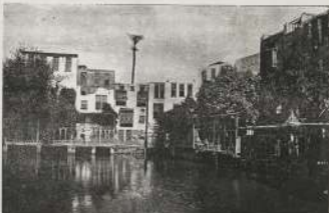
البحر المتوسط في الإسكندرية كما كانت سنة ١٩٦٠