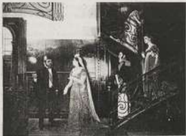
شعوب البحر المتوسط وعيون البحر من مصر