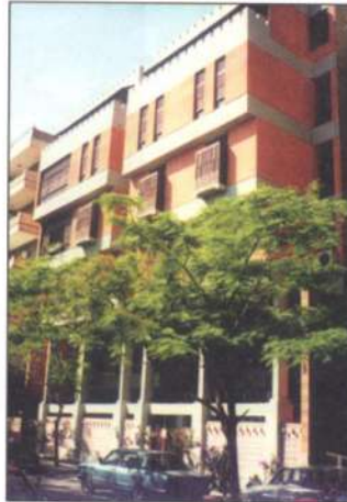
مقر مركز الدراسات التخطيطية والعمارية - القاهرة

Al-Sheikh Suliman Al-Ahmadi Building - Al-Madinah Al-Munawarah