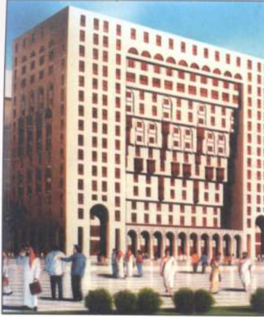
عمارة الشيخ سليمان الأحمدى - المدينة المنورة

Al-Sheikh Suliman Al-Ahmadi Building - Al-Madinah Al-Munawarah