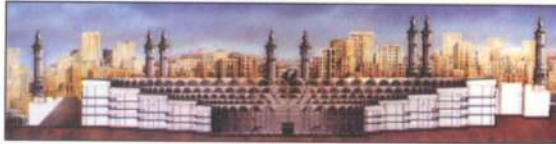
مشروع تخطيط للمنطقة حول المسجد الحرام - مكة المكرمة

Planning of the area around the Holy Mosque - Makkah Al-Mukarramah