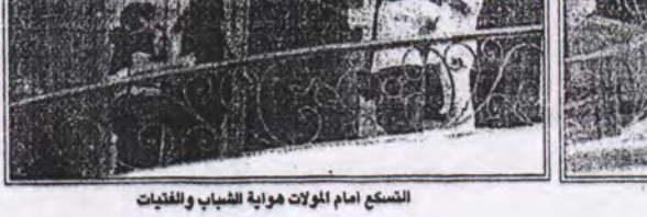
التسرع امام المولات هوية الشباب والفتيات