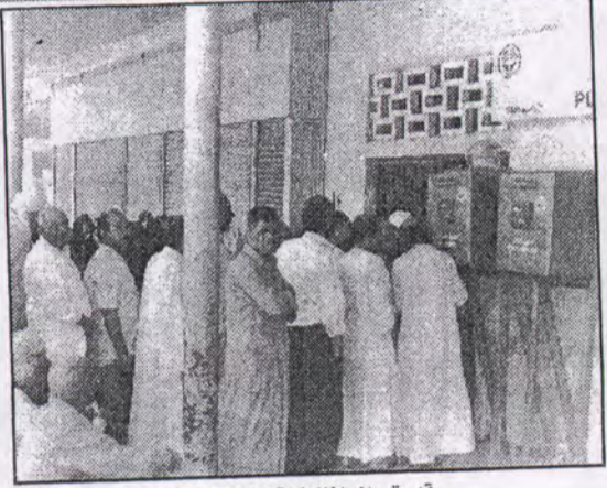
قد يقرر المحافظ إزالة هذا المكتب!

ويؤكد على أن إدارة عمران القاهرة تتعامل بسياسة رد الفعل لفعل سابق دون وجود رؤية واضحة ومتكاملة للمخططات العمرانية والاجتماعية والاقتصادية للقاهرة الأمر الذي يتطلب إعادة النظر في استراتيجية تنمية وإدارة القاهرة الكبرى ذلك أن الاستراتيجية القومية للتنمية في مصر تهدف إلى تنمية المناطق الصحراوية والجديدة بعيدا عن وادي النيل والدلتا ولكننا للأسف نجد أن القاهرة والتي تستوعب 25% من عدد سكان مصر تستحوذ على نحو 40% من الاستثمارات في مجالى المرافق والخدمات.