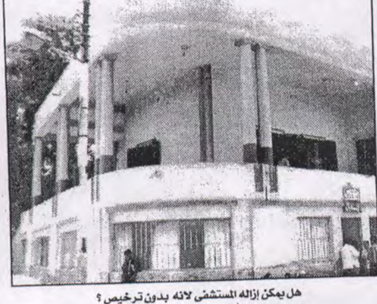
هل يمكن إزالته المستضى لانه بدون ترخيص؟