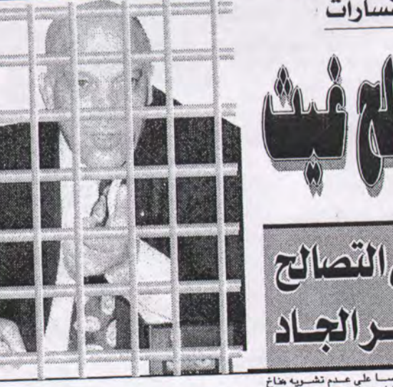
لمعالجة الموقف السئ... ولم الموضوع

في النزاعات القضائية بين رجال الأعمال والمهنيين العامة والمصالح الحكومية بالأخص مصلحة الجمارك والضرائب... والفصل في قضايا الإللاس... والقضايا بين المصدرين المصريين والمستوردين الأجانب أو العكس هو الصحيح.