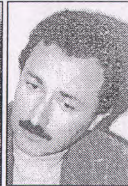
كابتن حورس الشمس