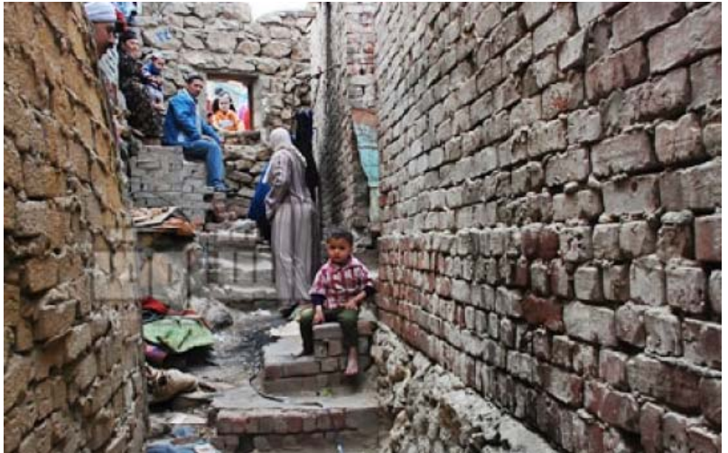
عائلة مصرية في إحدى عشوائيات القاهرة