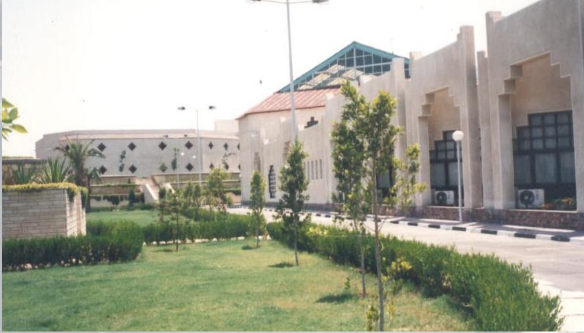
مبنى النادى الصحى وحمام السباحة المغطى – مرتبط مباشرة بالغرف الفندقية

تتميز مدينة الاسماعيلية بطابع معمارى خاص. ويجعلها موقعها على بحيرة التمساح وقناة السويس محط أنظار العابرين للقناة ، كما يجعلها مناخها المعتدل منتجعا حيويا صيفا وشتاء الأمر الذى يساعد على استمرار السياحة الداخلية لها طوال العام . وبالإسماعيلية امكانيات عديدة للتنمية والامتداد العمرانى لكنها تفتقد وجود مدينة رياضية متكاملة الأنشطة والرياضيات ، ونظراً لكل هذه العوامل مجتمعة تم اختيار مدينة الاسماعيلية لإنشاء قرية الشيخ عيسى الرياضية لتستضيف الفرق الرياضية المحلية والعربية لأقامة المعسكرات التدريبية والمسابقات الرياضية .