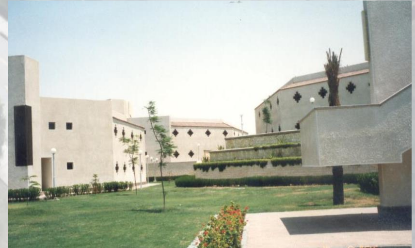
جانب من الغرف الفندقية وتميزها الفتحات الضيقة