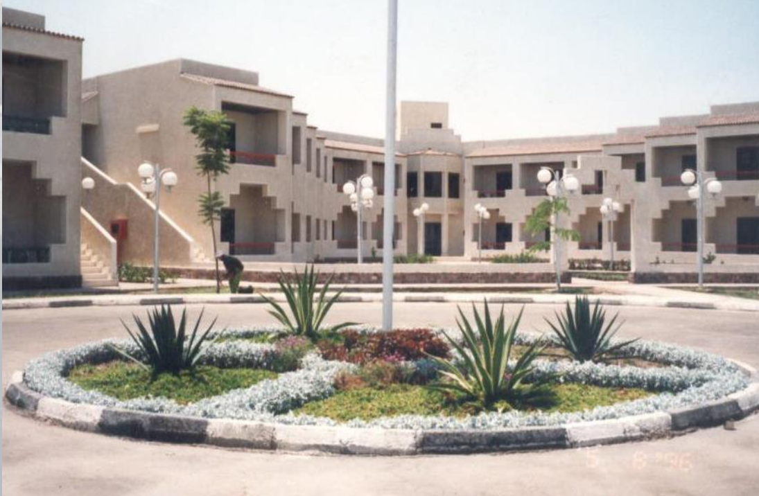
مجموعات الغرف الفندقية التى تطل مباشرة على قناة السويس

يتكون المشروع من ثلاث عناصر رئيسية هي الغرف الفندقية والصالة المغطاة التي تضم حمام السباحة وخدمات وصالة الجمنيزيوم المغطاة ويربط بين الصالتين المركز الصحي ، هذا بالإضافة الى ملاعب الاسكواش والمبنى الادارى و المطعم و ملاعب السلة و ملاعب التنس وباقي الأنشطة المكملة والخدمات اللازمة.