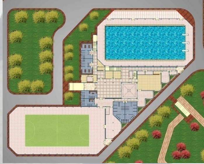
مسقط أفقى لمنطقة حمام السباحة والصالة المغطاة