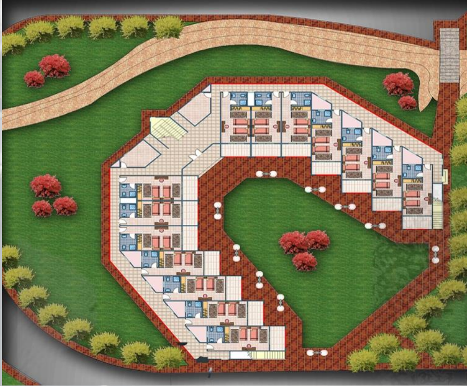
مسقط أفقى لمجموعة من الغرف الفندقية

يبلغ عدد الوحدات الفندقية نحو 140 غرفة مزدوجة مما يعطي طاقة استيعابية لنحو 280 شخص يقيمون إقامة دائمة بموقع المشروع وهي مجهزة لاستقبال الفرق الرياضية لعمل المعسكرات التدريبية . وقد قسمت على خمس مجموعات روعي في تصميمها إتاحة أكبر زوايا لاطلال جميع الغرف على قناة السويس، ويعمل هذا التقسيم على تسهيل إدارة وصيانة وتشغيل القرية بأى عدد من الفرق . وتبلغ مساحة الغرفة 20 م 2 ملحق بها حمام خاص.