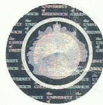
Lord Hart of Chilton Chancellor