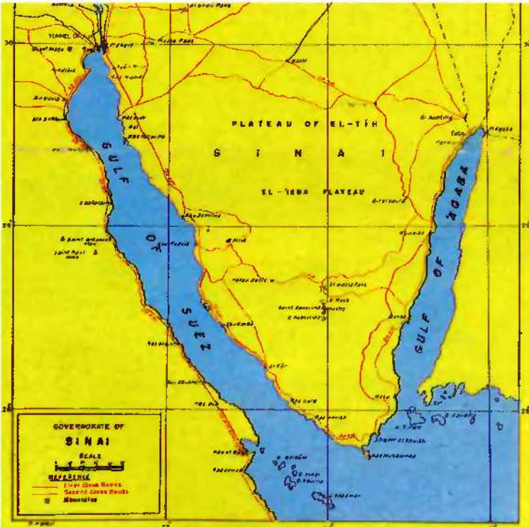
خريطة الطرق الرئيسية في سيناء

ولكن هناك تحذير وحيد بالأ تداخل كل هذه التراكيب من المنشآت بحيث تحجب المنظر الطبيعي الرائع في تفرد الجبال المقدسة ذات الوديان والشلالات الصغيرة . وفيما يختص بموقع النبي هارون الواقع في قلب مجمع الوديان الفائق الجمال فإن أي مساس به سوف يندس روعه المكان .