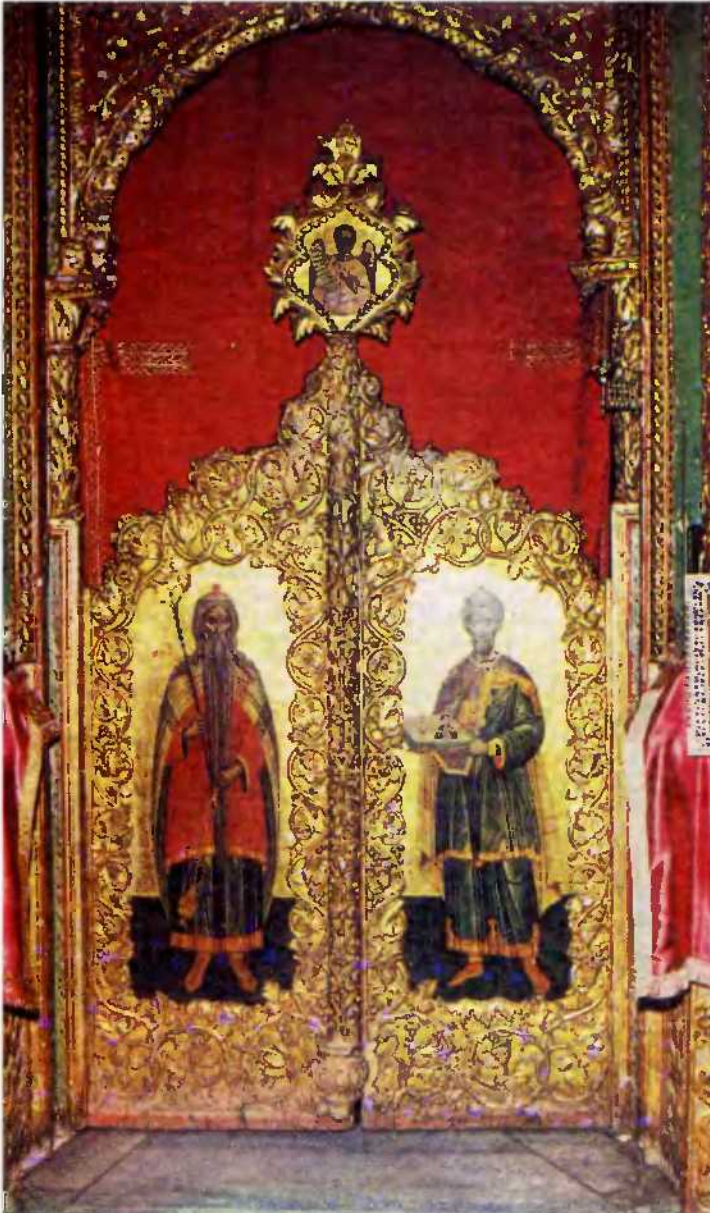
يمثل النير بالايغونات الاثرية النادرة