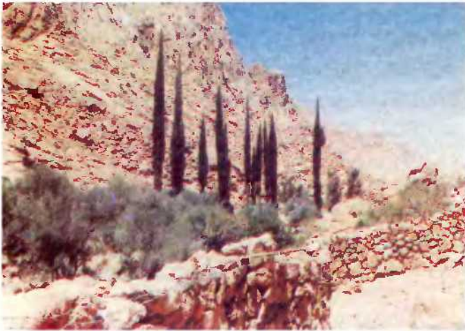
يتلاقى الموقع بنهاية وادي الاسباعية بوادي الاربعمين حيث السهول المرتفعة فوق سطح البحر والجبال المحيطة تخلف منظرا في غاية الدهشة والتفرد.

وتتميز هذه الجبال بميول حادة متموجه يصعب الصعود عليها بدون وجود مدقات محددة ومعروف اماكنها ، وتكون مسارات هذه المدقات حول الجبال بحيث تعطى ميول طويلة تسمح للشخص العادي بالصعود سيرا علي الاقدام .