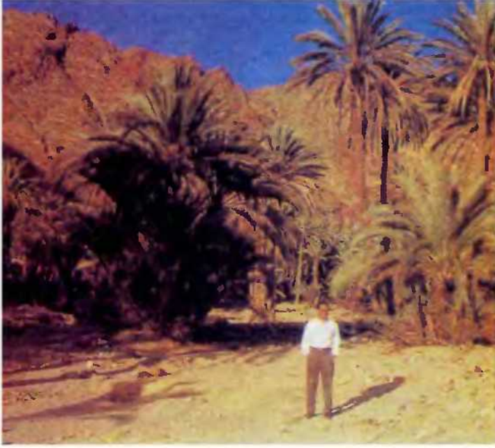
واحة فيران نموذج للبيئة الطبيعية الرائعة