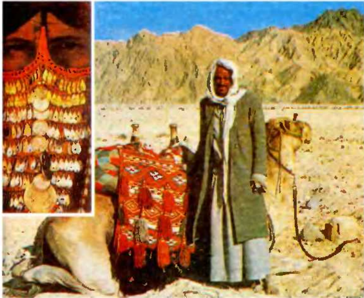
البدو بملايسهم و طبيعتهم الفطرية